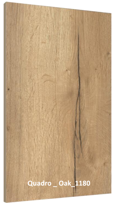
Quadro _ Oak_1180